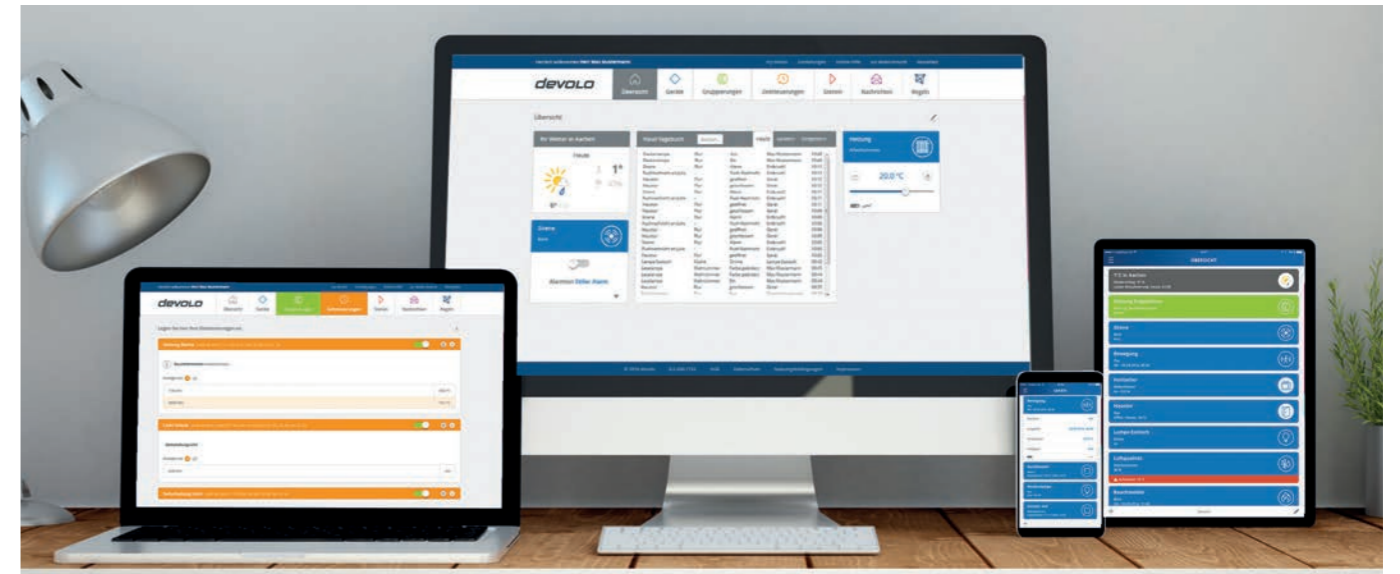
Zuhause alles in Ordnung. Per Smartphone, PC, Laptop oder Tablet kontrollieren und steuern Sie Ihr Zuhause.